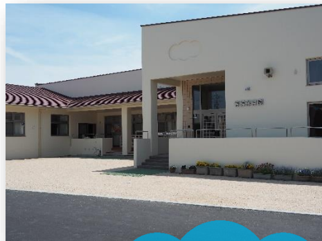
保育施設と 周辺マップ